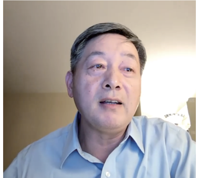
中国驻温哥华总领事馆经商参赞俞善君致词