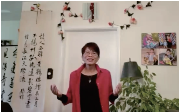
加拿大卑诗省前国际贸易厅长屈洁冰在致辞