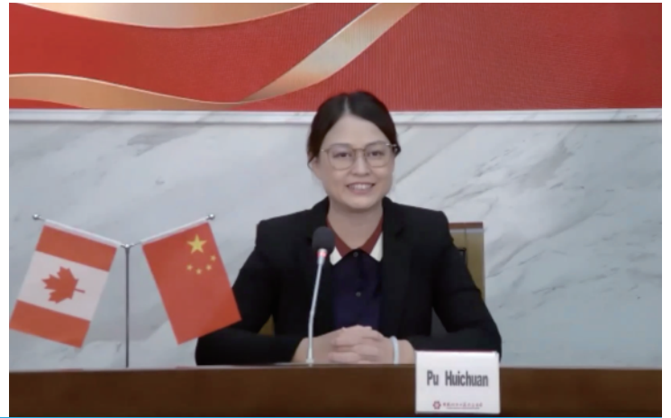
中国外贸中心代表介绍本届交易会发展新模式和平台优化功能